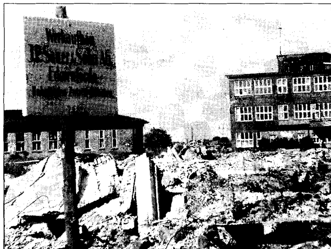
Aus Trümmern entstanden: J. P. Sauer & Sohn. Heute ein weltweit operierendes, stark exportorientiertes Unternehmen.