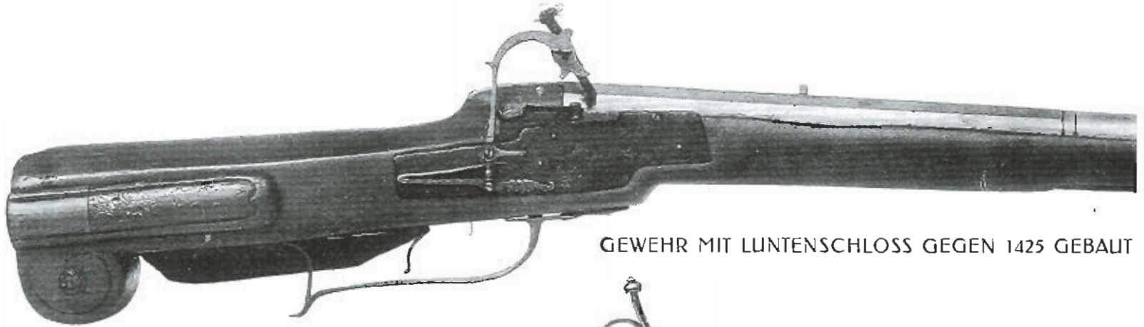
GEWEHR MIT LUNTENSCHLOSS GEGEN 1425 GEBAUT