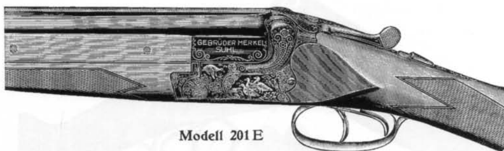
Modell 201 E